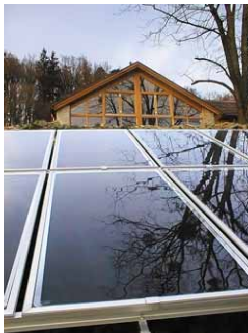
■ Die Kombination von Flüssiggas und Solaranlage kann sowohl im Neubau als auch bei einer Renovierung zum Einsatz kommen.

Wie der Trend der letzten Jahre zeigt, fallen diese Entscheidungen inzwischen meistens zugunsten einer modernen Gas-Heizzentrale aus. Vor allem die wirtschaftliche Gas-Brennwerttechnik, bei der zusätzliche Wärmeleistung aus dem Kondensat der Abgase gewonnen wird, setzt sich als erste Wahl für energiesparende Heizungsanlagen durch. Was bei einer Modernisierung jedoch nicht vergessen werden sollte: Am kostengünstigsten ist jede Heizung natürlich in den Phasen, in de-